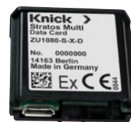
Micro-USB-Anschluss Systemanschluss Stratos Multi

Hinweis: Die Speicherkarte ZU1080-S-X-* darf im Nicht-Ex-Bereich an einen gewöhnlichen PC angeschlossen werden.