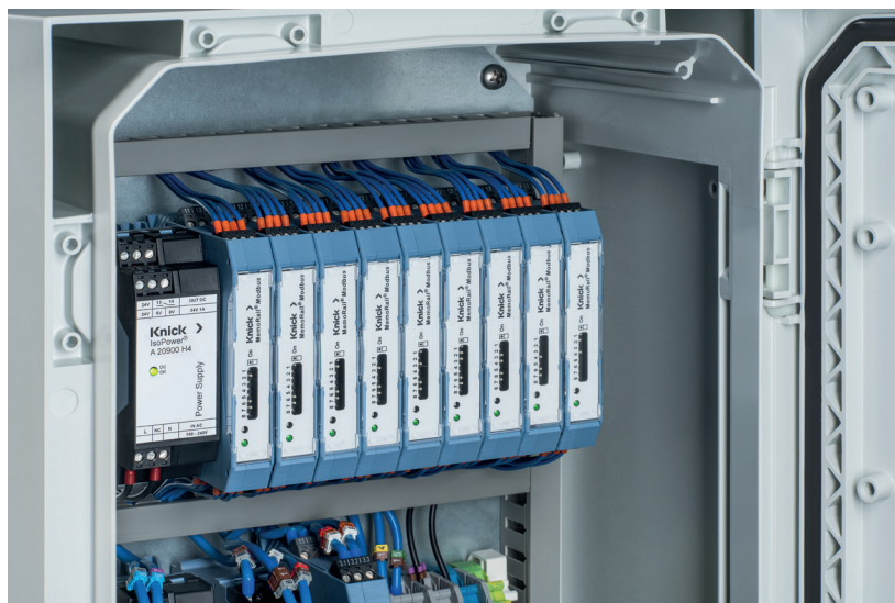
Instalación en un armario eléctrico